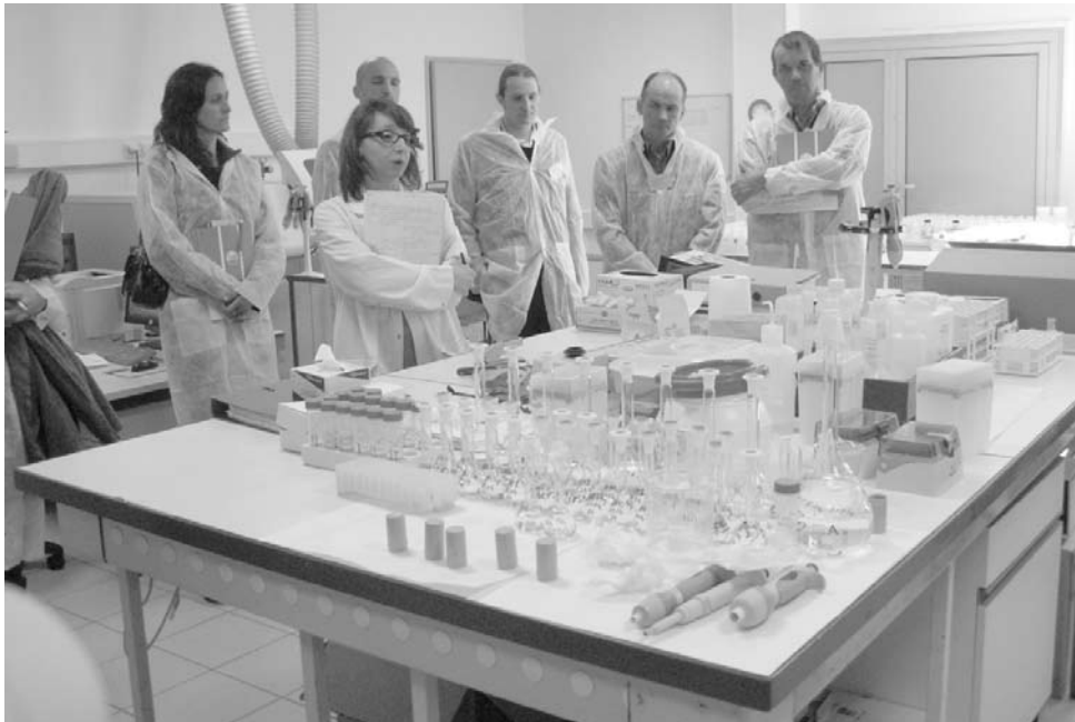
Visite du laboratoire